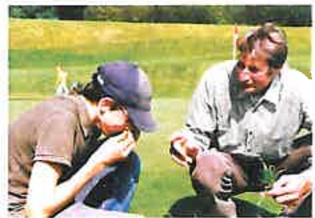
Head-Greenkeeper bei einer Gräserbestimmung mit Jugendlichen.