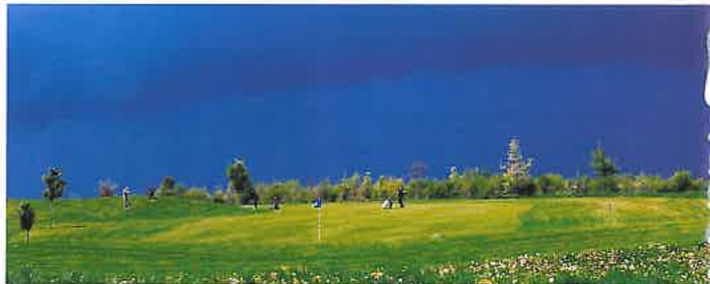
Gut gepflegte Plätze faszinieren Golfer bei jedem Wetter.

Wer und wie wird man „Greenkeeper“? Es ist ein klassischer Fortbildungsberuf und so wie viele Wege nach Rom führen, gibt