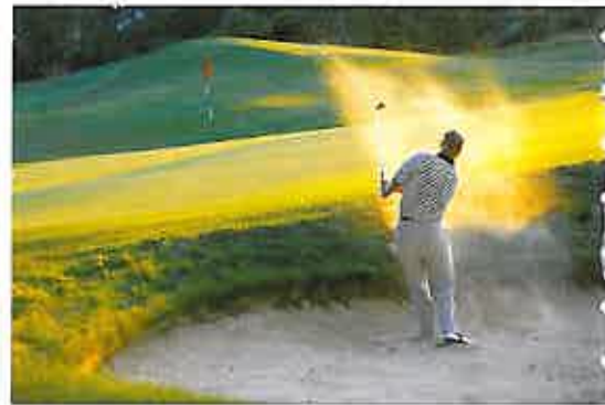
... und zu jeder Tageszeit.

Um Golfplätze zu einem landschaftlichen und spielerischen Kleinod zu entwickeln, müssen diese Menschen gleichzeitig Manager, Agronom, Techniker, Ökologe, Kaufmann und auch Golfer sein. Im Folgenden seien einige typische Aufgabenbereiche für