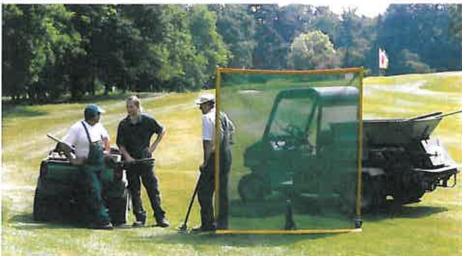
Head-Greenkeeper bei einer Besprechung mit seinen Mitarbeitern.

ne Mitglieder Ausbildungs- und Fortbildungsveranstaltungen. Da auch im Greenkeeping der Grundsatz vom „lebenslangen Lernen“ gilt, unterstützt der GVD grundsätzlich qualifizierte Ausbildungsangebote und hat aufgrund dessen ein eigenes System zur Zertifizierung regelmäßiger Fortbildung eingeführt. Deshalb sieht der GVD eine wichtige Aufgabe darin, die Zusammenarbeit auf dem Gebiet der Aus- und Weiterbildung zu intensivieren und durch den GVD-Weiterbildungsausschuss und die Arbeitsgemeinschaft-Greenkeeper-Qualifizierung (AGQ) bundesweit mit zu gestalten.