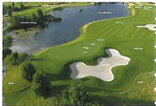
Golfelemente auf einer Spielbahn.

einen modernen Head-Greenkeeper aufgelistet, hinterlegt mit Zahlen für eine durchschnittliche 18-Löcher-Anlage: – Verantwortung für die Pflege der Grüns,