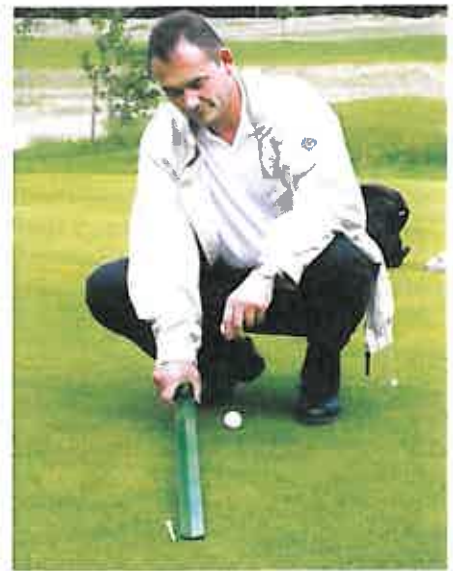
Rasexperte beim Messen der Ballroll-distanz auf einem Golfgrün.