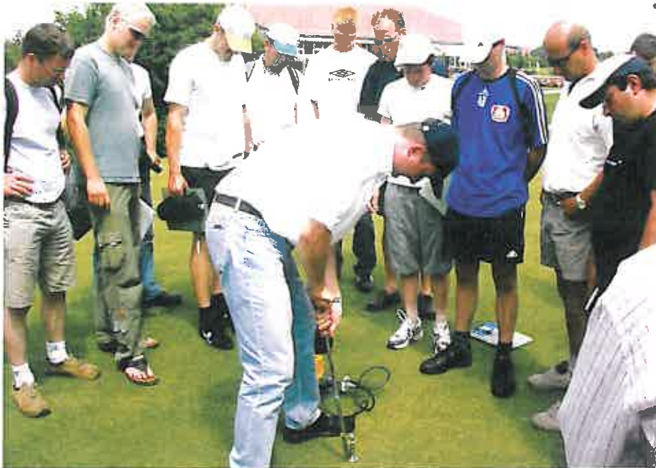
Greenkeeperausbildung: Gasmessung in der Rasentragschicht.