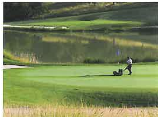
Greenkeeper beim morgendlichen Mähen eines Grüns.

ser Flächen insgesamt eine große Bedeutung beigemessen wird und deshalb auch die Head-Greenkeeper für Ihre Pflegeleistung die entsprechende Wertschätzung erhalten. Fragt man amerikanische Golfer nach ihrem Platz, so kennen sie meist den Architekten, den Superintendent (Head-Greenkeeper) und zum Teil auch die unterschiedlichen Grasarten – weil dies sich alles gravierend auf ihr Spiel auswirkt. In Deutschland dürften diese Fragen meist unbeantwortet bleiben.